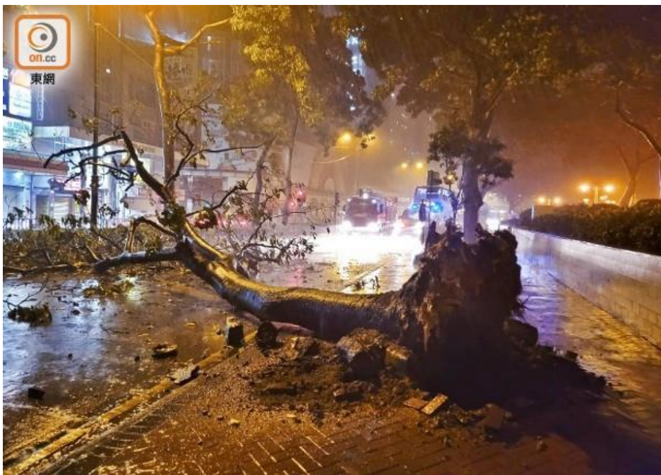
漆咸道南有 8 米高大樹倒塌，連根拔起。