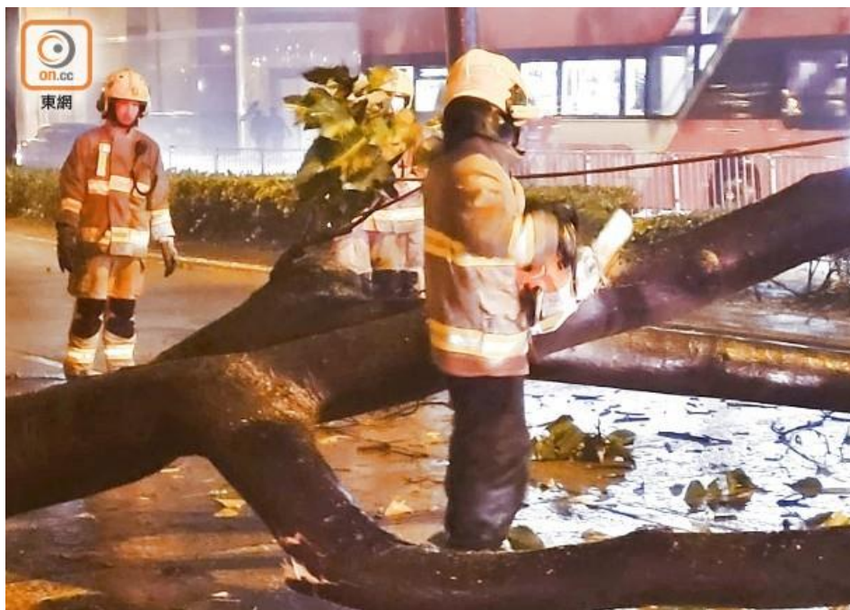
消防將樹幹鋸開。