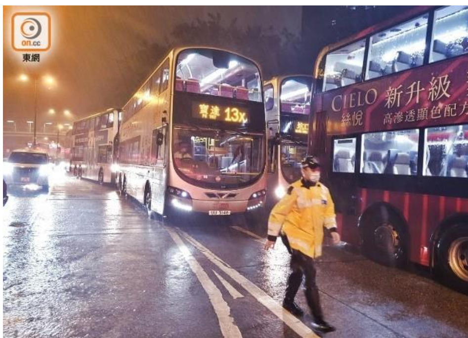
受事件影響，現場出現車龍。