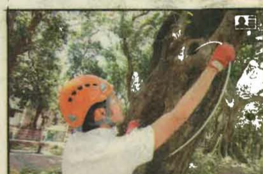
● 不少行醫工具都是自製，包括量度樹洞深度的喉管。