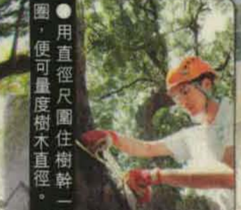
● 用直徑尺圍住樹幹一圈，便可量度樹木直徑。