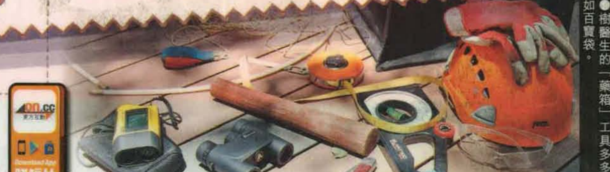
● 樹醫生的「藥箱」工具多多如百貨袋。