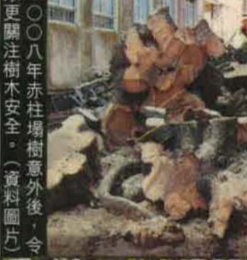
● 二〇〇八年赤柱塌樹意外後，令大眾更關注樹木安全。