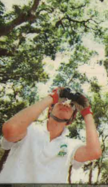
● Hindley 以高度計為樹木度高。